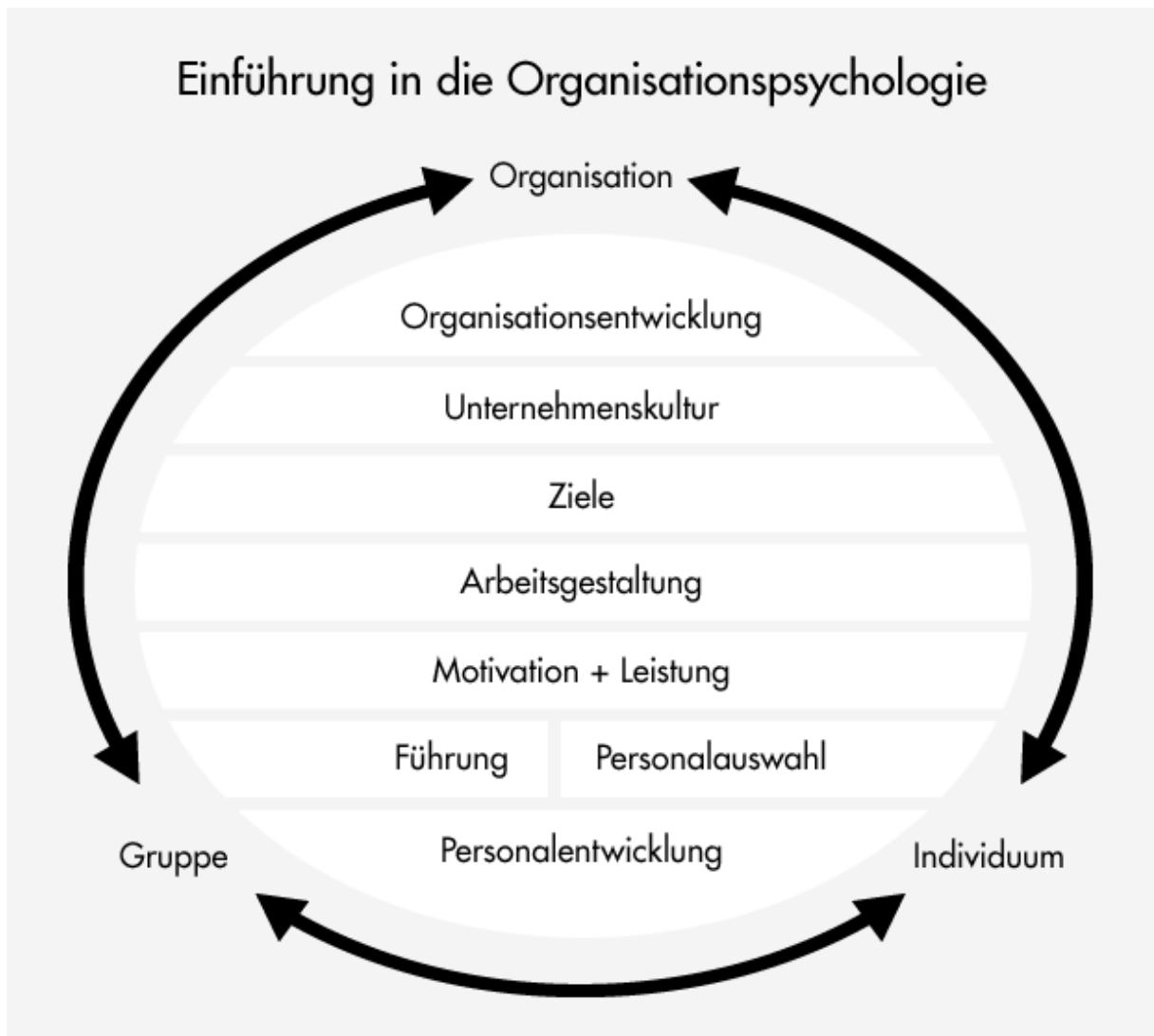
Abbildung: Beispiel für eine grafische Themenübersicht zur Organisationspsychologie