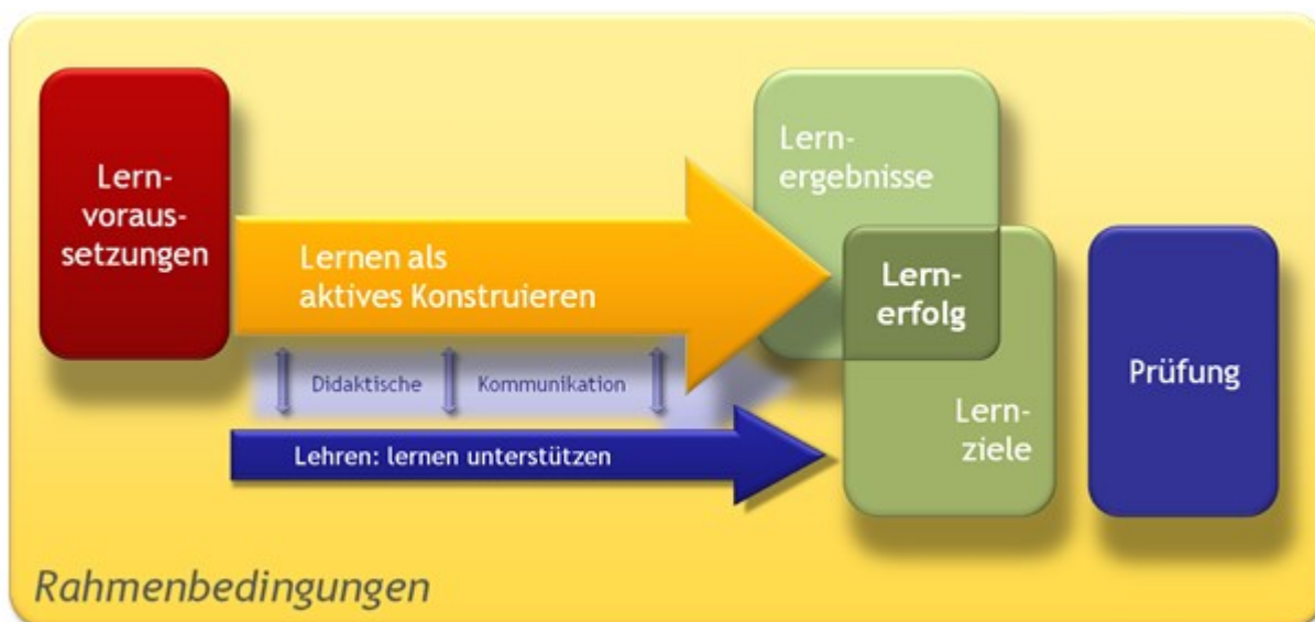
Abbildung 1.1: Konstruktivistisches lernzielorientiertes Lehr-Lernverständnis.

Im Mittelpunkt der Abbildung 1 steht ein lernzielorientiertes konstruktivistisches Verständnis von Lehren und Lernen: Lernen setzt bei den Lernvoraussetzungen der Lernenden an. Damit sind einerseits die fachlichen Kompetenzen der Lernenden gemeint, über die sie bereits verfügen, aber auch ihre methodischen: Lernende, die noch nie eine Gruppenarbeit erlebt haben, bringen beispielsweise für diese Methode besondere Voraussetzungen mit, z.B. könnte