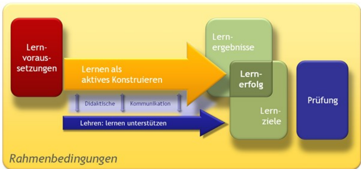
Abbildung 1.1: Konstruktivistisches lernzielorientiertes Lehr-Lernverständnis.

Im Mittelpunkt der Abbildung 1 steht ein lernzielorientiertes konstruktivistisches Verständnis von Lehren und Lernen: Lernen setzt bei den Lernvoraussetzungen der Lernenden an. Damit sind einerseits die fachlichen Kompetenzen der Lernenden gemeint, über die sie bereits verfügen, aber auch ihre methodischen: Lernende, die noch nie eine Gruppenarbeit erlebt haben, bringen beispielsweise für diese Methode besondere Voraussetzungen mit, z.B. könnte