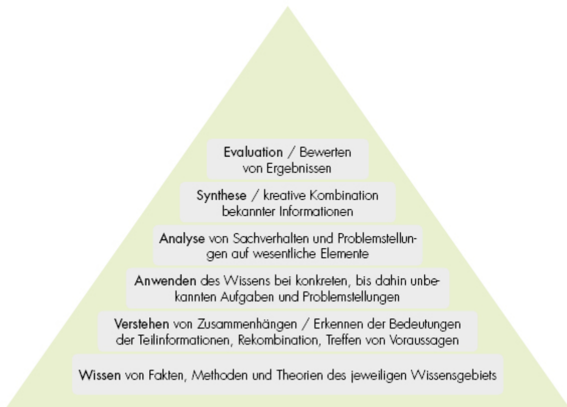
Abbildung: Schematische Darstellung der kognitiven Lernzieltaxonomie

Um in der Lehre vom Einfachen zum Schwierigen, vom Überschaubaren zum Komplexen voranzuschreiten, ist eine Einordnung kognitiver Lernziele hilfreich. Die Taxonomie kognitiver Lernziele nach Bloom ermöglicht diese Einordnung anhand verschiedener, aufeinander aufbauender Lernstufen. Schematisch kann die kognitive Lernzieltaxonomie wie folgt dargestellt werden: